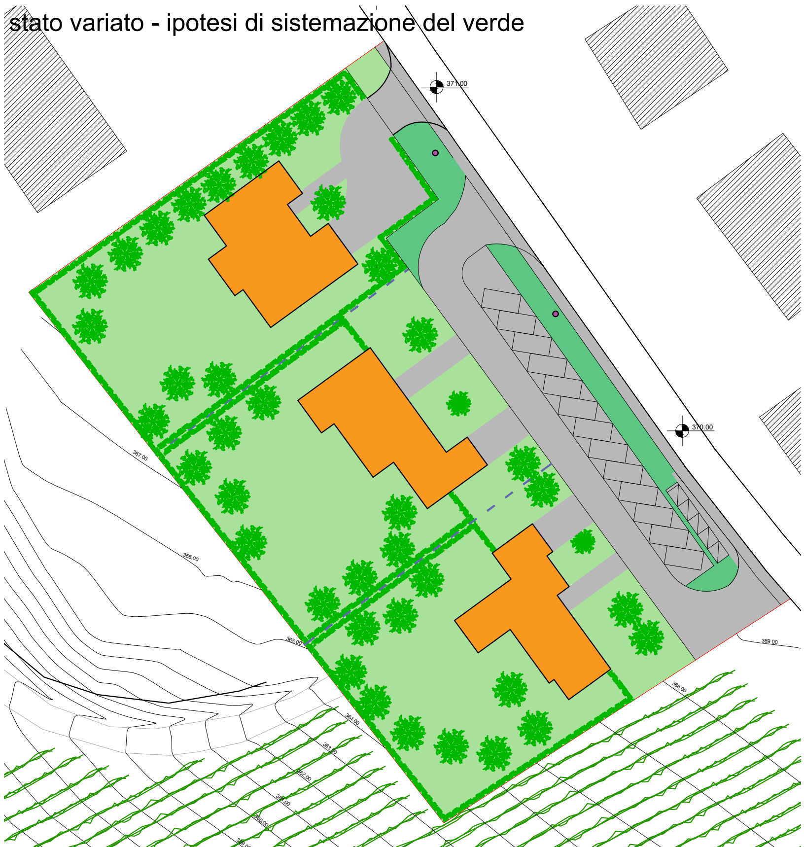
stato variato - ipotesi di sistemazione del verde